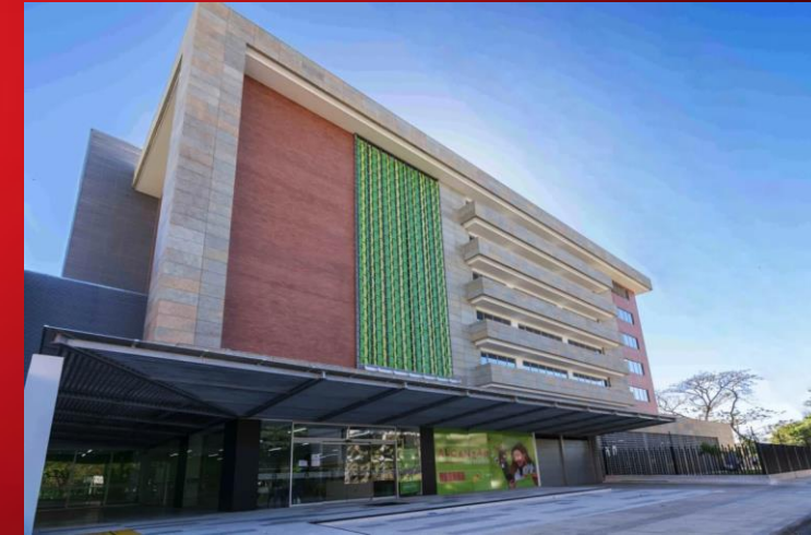
U. ÁREA ANDINA