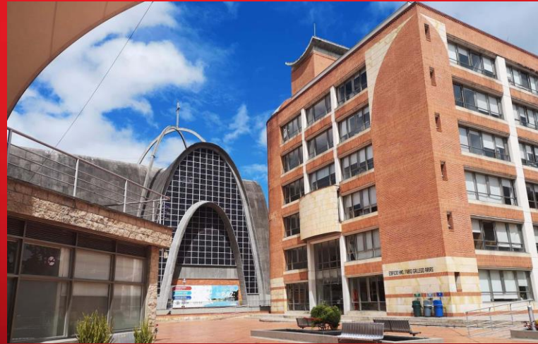
U. LA SALLE