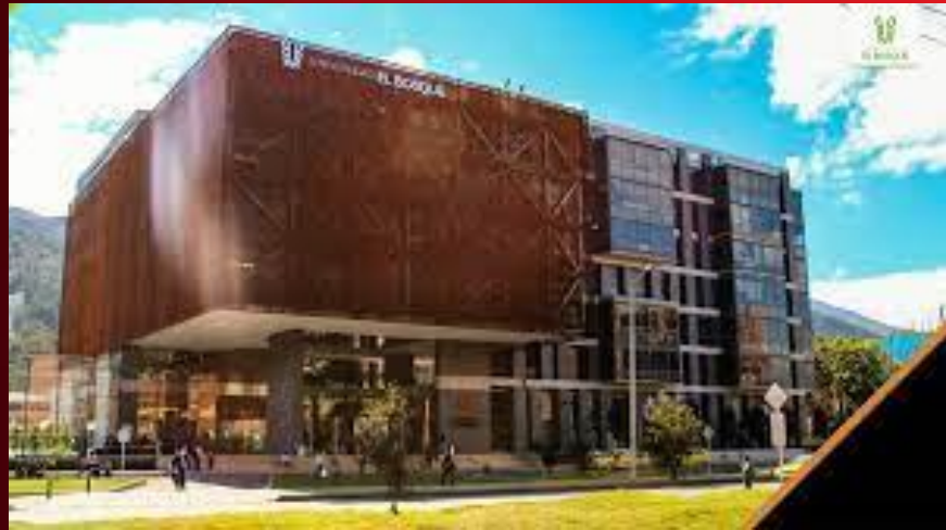
U. EL BOSQUE

Compartirás con directivos, docentes y administradores. Conocerás la infraestructura de la universidad, espacios de Optometría, laboratorios, consultorios y salones de clase. Cada institución promoverá el crecimiento e intercambio académico y profesional en América Latina. Cada visita tendrá duración entre 1 y 1.5 horas